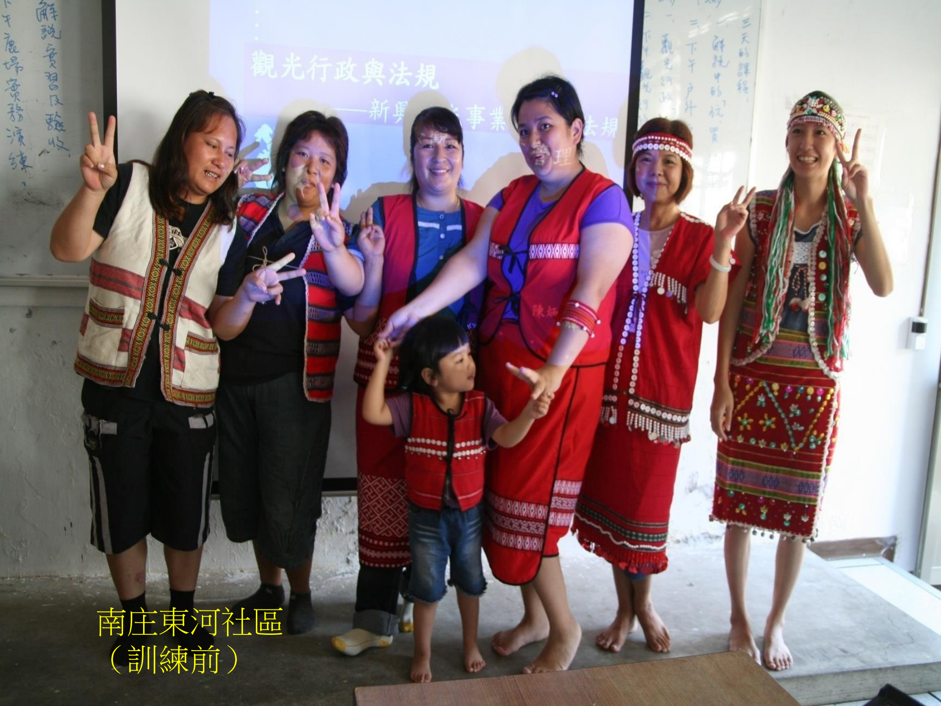
南庄東河社區 (訓練前)